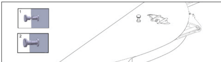
Image 1. Le déverrouillage du bras de levage: tirez le bouton et tournez d'un quart de tour.

Vous pouvez verrouiller le bras de levage quand il est posé vers le bas. Ceci empêche au bras de levage de se lever à l'improviste. Utilisez le bouton du côté de Wheelylift.